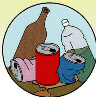
空き瓶・缶・ペットボトル