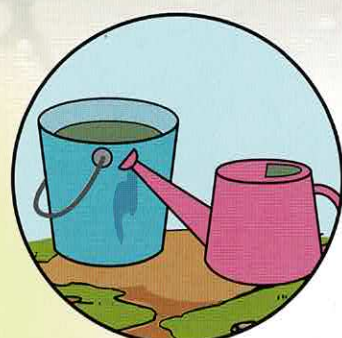
雨ざらしのバケツ・じょうろ